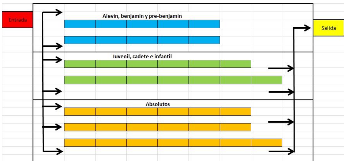
Figura 3. Procedimiento zona de boxes.