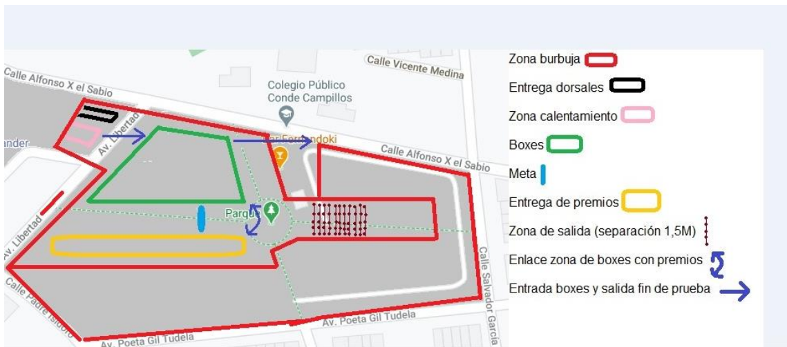
Figura 1. Plano general de carrera